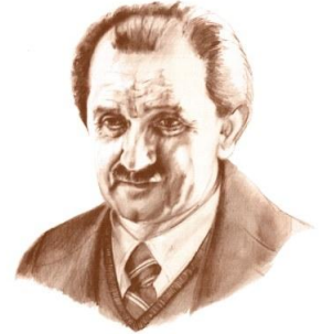
Dr. Ferdinand Porsche